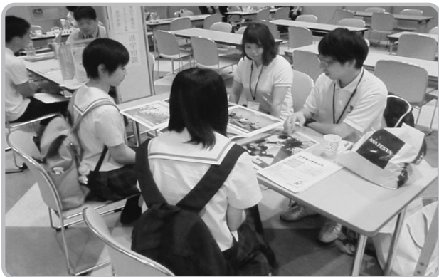
秋田県理学療法士会の紹介ブース