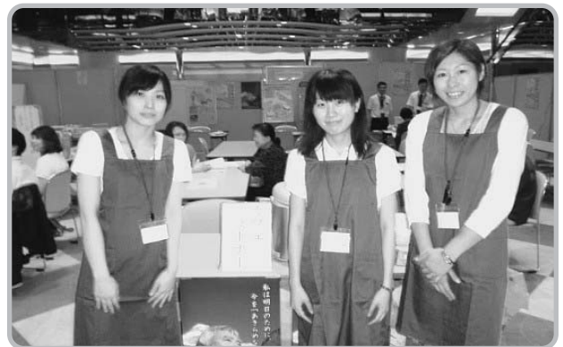
理学療法士が担当するカフェコーナー