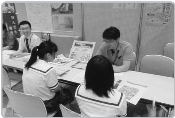
高校生を対象にした進路相談

平成28年7月17日、秋田アトリオンにおいて「2016理学療法週間公開講座」が開催されました。同日、日本理学療法士協会による介護予防推進キャンペーンがスタートし、当公開講座も含めて全国的に介護予防関連のイベントが一斉に開催されました。