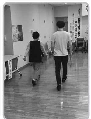
身体機能測定が行われ、多くの参加者で賑わいました。