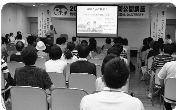
大盛況となった願法氏による講演