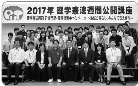
大成功に終わりました。

メイン会場の隣では、当会スポーツ支援活動の報告や理学療法士養成校の進路相談、秋田県作業療法士会、秋田県言語聴覚士会など後援団体の展示ブースが設置され、老若男女問わず、たくさんの方々にご来場をいただきました。