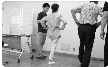
身体機能測定では、結果をもとに当会会員がわかりやすく説明しました。