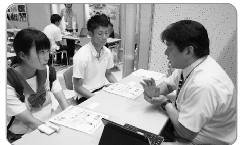
スポーツ支援活動の紹介や学校の紹介コーナーの様子。どちらも高校生に人気でした。

H30年度も理学療法公開講座を開催いたします。7月8日(日)の予定です。 秋田県理学療法士会は地域で元気に暮らす人々を応援するため、 公開イベントを多数予定 しております。随時情報を更新いたしますので、ホームページやチラシをご確認ください。