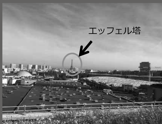
会場のテラスからは遠くにパリのシンボル、エッフェル塔を見ることができました。

学会全体を通じて欧州各諸国の取り組みに大変刺激を受けました。国際学会というだけに多様な価値観を意識させられる機会となり、今後日本に合った介入法を考えていく上で参考にしていきたいと思う所存です。下の写真はシンポジウムで私が登壇している間の写真ですが、一人でいたアジア人を気遣ってくださり、別のシンポジストの先生が撮ってくださいました。ありがたくて泣きそうになりました。国境を越えて人の温かさに触れることができることも国際学会の醍醐味かと感じます。