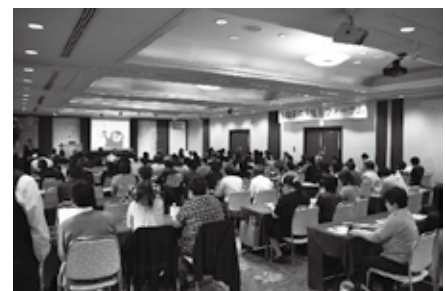
↑会場の様子 ↓シンポジウムの様子

多数の当会会員の方々にご参加いただきまして、最終的な参加者は、総数121名（PT23名、OT15名、ST5名、介護支援専門員61名、医師7名、その他10名）となり、盛大なものとなりました。これもフォーラム運営の中心メンバーとなったリハ専門職協議会南部ブロック横手支部の方々のご尽力の成果だと思います。大変お疲れ様でした。