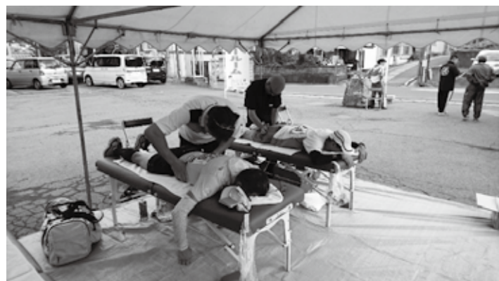
今回のトレーナー（左）とトレーナールームの様子（右）