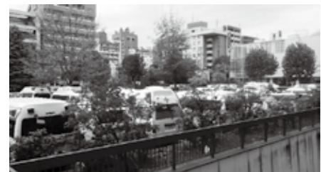
30～40台の救急車が集結